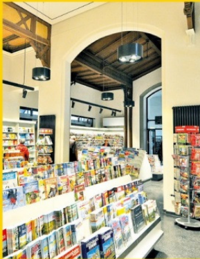
Ein Podium für Print: Wo Tradition und Innovation eine Symbiose bilden